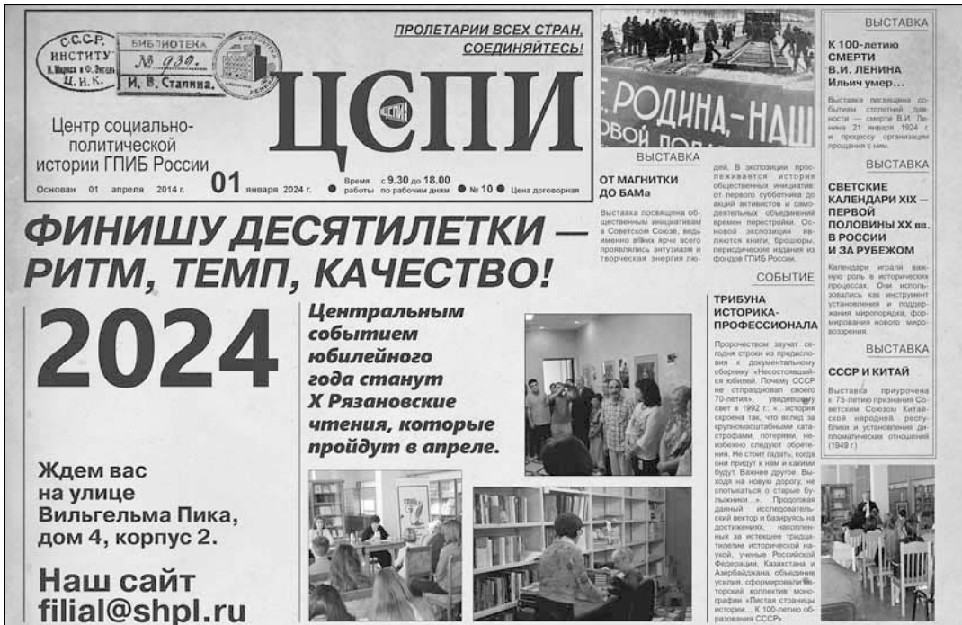
Рис. 4. Афиша выставки «10 лет ЦСПИ» (фрагмент)

Франции (1648—1653), имеется и виртуальная выставка, посвященная этим материалам [47]. Также ведется работа по изучению дореволюционных эмигрантских библиотек [48].