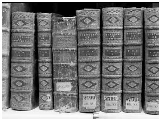
Рис. 1. Редкие и ценные фонды ЦСПИ

нее была известна как библиотека Института марксизма-ленинизма (ИМЛ), в результате объединения с Государственной публичной исторической библиотекой (ГПИБ) России. Главное, что при этом в выигрыше остались читатели (в том числе и в режиме онлайн).