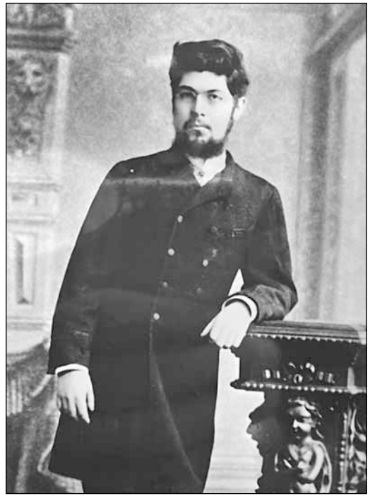
Рис. 6. Лев Петрович Шибанов. 1880-е гг. ОР РГБ. Ф. 342. К. 59. Д. 47. Л. 1

Из письма Н.А. Попову следует, что в июле 1890 г. молодой тогда ученый послал ему несколько экземпляров собственных трудов для библиотеки Московского архива Министерства юстиции, а для личного собрания — свою первую публикацию — заметку о профессоре Казанского университета Г.Н. Городчанинове [72]. Письмо позволяет уточнить судьбу этого издания. Н.П. Лихачев сообщал адресату, что дарит ему один из 34 экземпляров, напечатанных для раздачи в день серебряной свадьбы родителей [26, л. 3]. Из других источников известно, что тираж брошюры составлял 585 экземпляров, однако Д.В. Ульянинский отметил, что она имелась и в другом формате — в 4 0 , отпечатанном «самым незначительным числом» (правда, так и не назвав его) [73, с. 165]. Таким образом, логично предположить, что