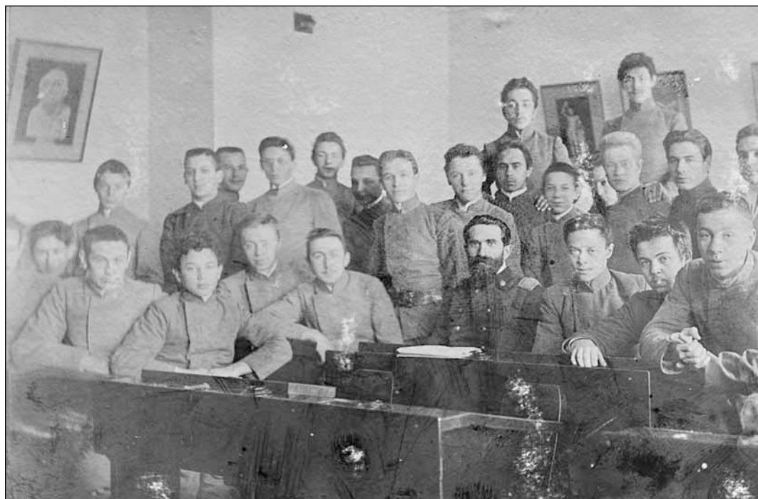
Рис. 5. Яков Лазаревич Барсков с учениками Пятой московской гимназии. 1910-е гг. ОР РГБ. Ф. 16. К. 24. Д. 1. Л. 1 об.

Л.Э. Бухгейму, например, выражалась «сердечная благодарность» за «особый экземпляр» первого тома сочинений историка литературы и библиографа М.Н. Лонгинова [66] и список трудов С.А. Венгерова [67; 33, л. 5].