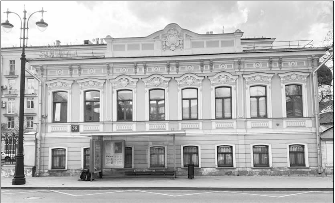
Рис. 11. Дом Карповых в Москве на улице Большая Ордынка, где Н.П. Лихачев жил в 1917–1918 гг. 2024 г. (ныне Большая Ордынка, д. 36)

вия относительно бумаги и печатания. Я смирился — ничего не печатаю и не подготавливаю к печати» [33, л. 5].