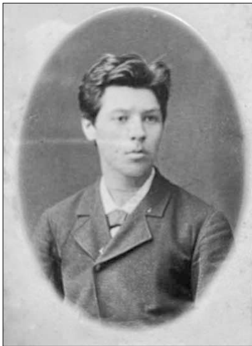
Рис. 8. Павел Петрович Шибанов. 1881 г. ОР РГБ. Ф. 342. К. 59. Д. 41. Л. 1 об.