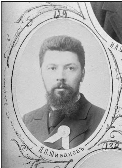
Рис. 9. Павел Петрович Шибанов. 1895 г. ОР РГБ. Ф. 573. К. 72. Д. 1. № 129

чева. В декабре 1923 г. ученый обещал привезти в Москву для Н.Н. Орлова список своих работ, упомянув при этом, что самая полная его библиография находится в библиотеке Исторического музея [34, л. 12].